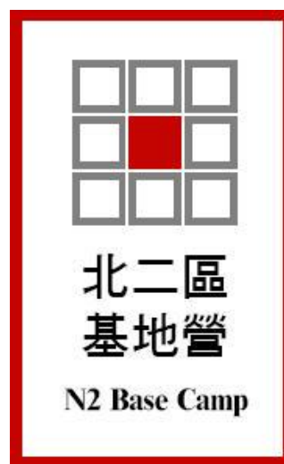
圖 2：北二區基地營之服務標章

(二) 北一區館際合作借書證：臺大圖書館提供館際合作借書證給北一區夥伴學校，各夥伴學校師生均可持證至臺大圖書館使用紙本及電子資源。